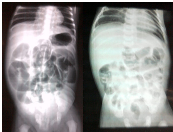
Figura 1. Radiografía simple de abdomen. Se observa asas intestinales apelotonadas, con edema interasas y niveles hidroaéreos.

En la radiografía simple de abdomen se observan asas intestinales apelotonadas, con edema interasas, nivel hidroaéreo, no se observa aire en la ampolla rectal (figura 1).