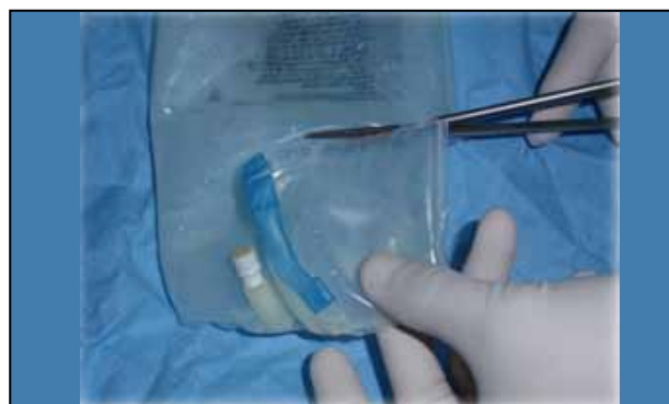
Figura 1. Fabricación del dispositivo.

Se realiza la exposición del área cruenta, se toma una solución salina; su contenido es vaciado en una bandeja plástica, estéril para su utilización, como se observa en la figura 1.