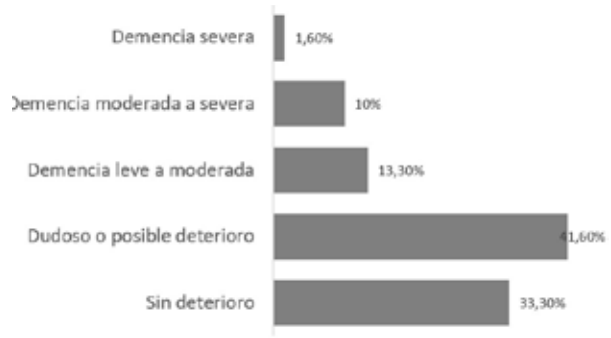
Figura 3. Distribución de los resultados del minimental test de en pacientes ERCT-HD

Al realizar el test de minimental, los resultados se distribuyeron de la siguiente manera: 20 pacientes sin deterioro, 25 con deterioro cognitivo, 8 pacientes con demencia leve, 6 pacientes con demencia moderada, 1 paciente con demencia severa, (figura 3).