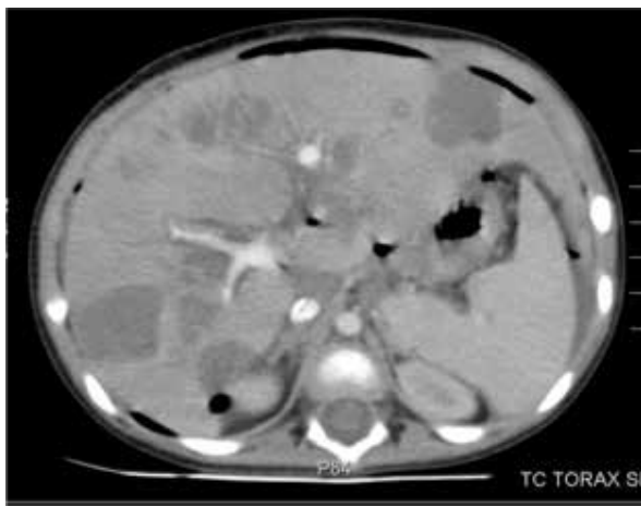
Figura 1. TAC abdominal de la paciente en la que se evidencia lesiones infiltrativas en hígado

Bh leucocitos 4650 N 29% L 62% Hb: 9mg, Hto: 27%, PLt: 220.000. TGO: 214, TGP: 130, BT 2,3, BD 1,5, BI 0,75, Na 133meq/l, hipoalbuminemia 1,5g/dl. Hipofibrinogenemia 79, Hipertrigliceridemia 438, PCR 5.3 , PCT 0.49, Hiperferritinemia 1059 - 26855, IL 6 14.9, LDH 1224 Tac Tórax y abdomen: imágenes infiltrativas en pulmones, hígado, (Figura 1) Biopsia hepática: pericolangitis, fibrosis periductal y micro focos de abcedación. Aspirado medular: celularidad disminuida, serie blanca seg 33%, cay 7%, mielocitos seg 8%, promielocitos 2%, linfocitos 10%, serie plaquetaria con megacariocitos +++, presencia de hemofagocitosis, (Figura 2) Inmunofenotipo de aspirado medular negativo para malignidad.