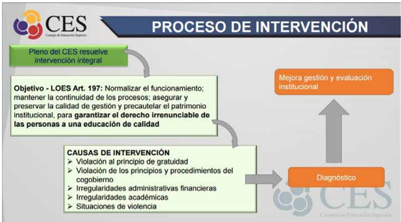
Cuadro 2: Proceso de intervención del CES