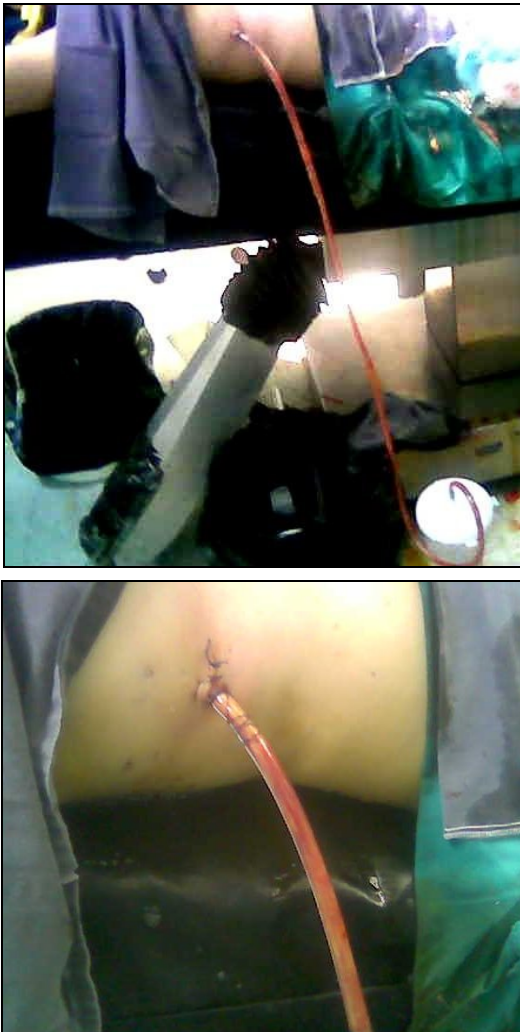
Figura 2 Toracostomía mínima derecha

Obsérvese la salida de líquido marrón rojizo (como pasta de anchoas) en gran cantidad.