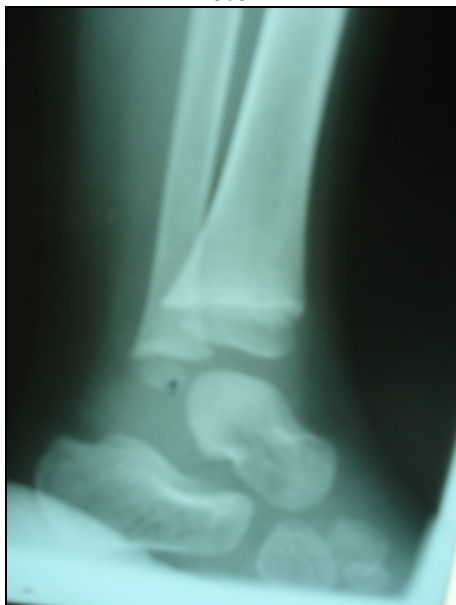
Pie: Alteración del arco a nivel del astrágalo.