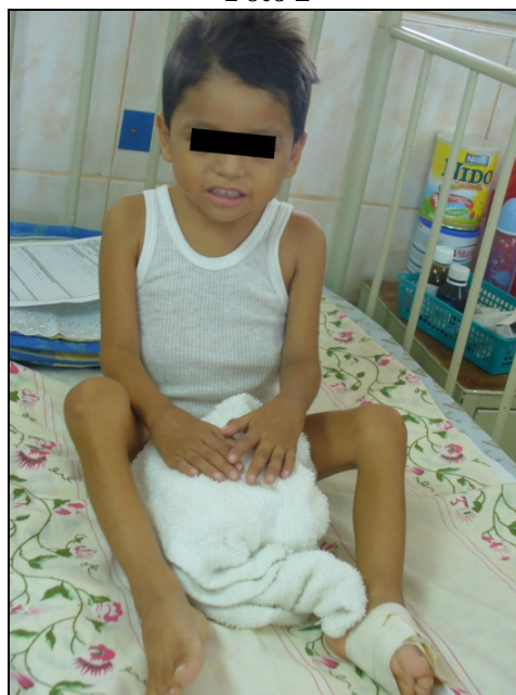
Pie: Alteraciones óseas en manos y pies.