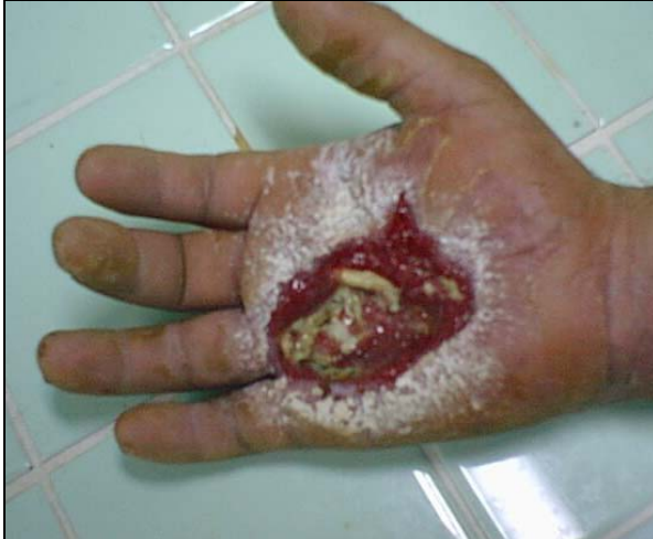
Foto 2 Desbridamiento de piel necrótica

Se le realizó limpieza quirúrgica del área necrótica; luego de curaciones del área cruenta con sulfadiazina de plata, se decidió levantar un colgajo inguinal. Foto 2.