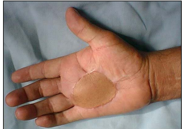
Foto 4 Resultado

Se suturó el colgajo a los bordes del defecto y se tubulizó el pedículo. Al cabo de 3 semanas se procedió a liberar el colgajo, previo pinzamiento por 5 minutos con clamp intestinal, para verificar la vascularización del mismo. Foto 4.