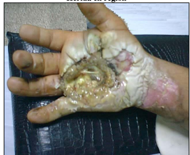
Foto 1 Herida en región

El caso corresponde al de un paciente de 43 años de edad con antecedente de trauma de mano por quemadura eléctrica en región palmar derecha y exposición tendinosa más lesión de tendones flexores superficiales y profundos de 2do. 4to. y 5to. dedos. Foto 1.