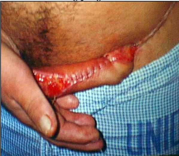
Foto 3 Colgajo inguinal

La técnica fue la siguiente: incisión de la elipse de la porción lateral hacia la porción medial del colgajo, incluyendo la fascia, hasta el borde lateral del músculo sartorio. Foto 3.