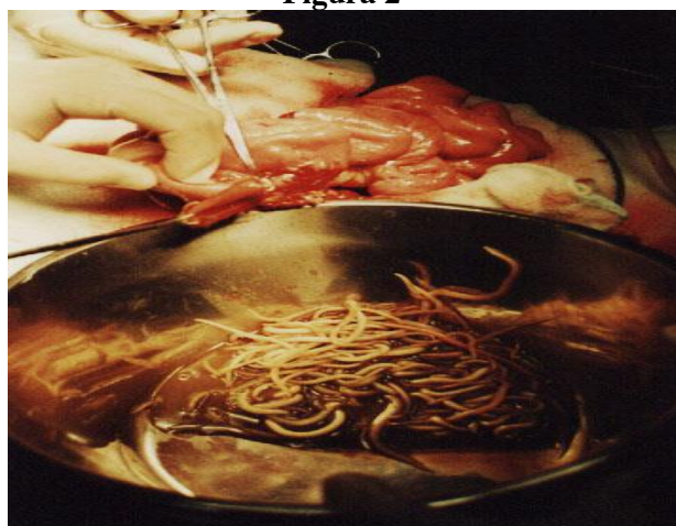
Fig.2: Paquete de áscaris contenidos en segmento distal de íleon.