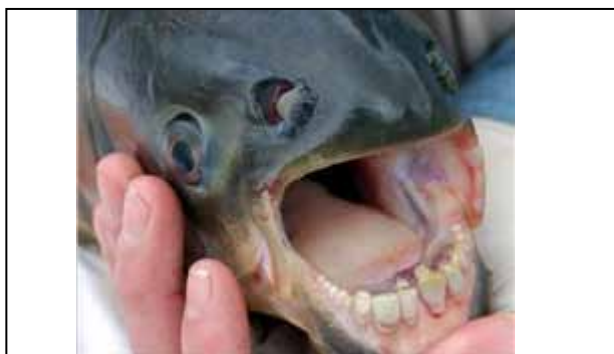
Figura 15. Picú o cortabolas.

Sus fuertes dientes se parecen a los de los humanos y puede provocar graves heridas (figura 15).