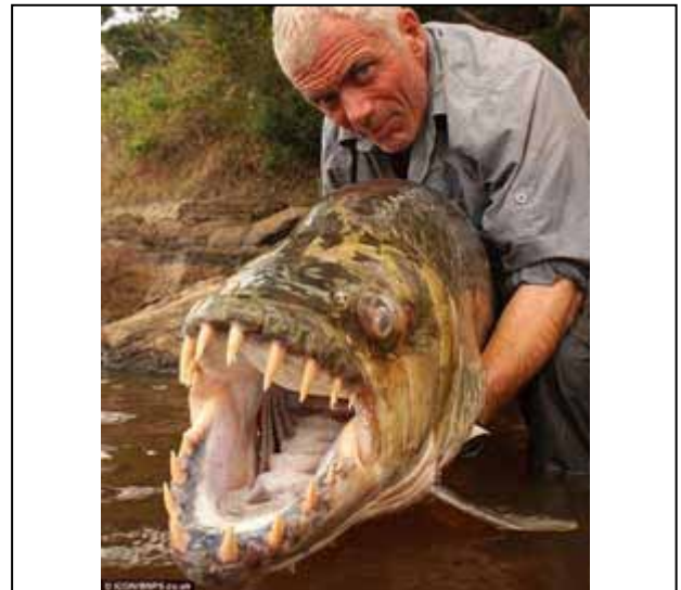
Figura 13. Pez Tigre Goliat ( Hydrocynus vittatus ).

Se encuentran en África en los grandes ríos como el Congo, Zambeze y el embalse de Kariba, en la cuenca del río Lualaba, el lago Upemba y el lago Tanganica. En raras ocasiones ataca a los humanos, a los cuales arranca dedos, brazos, piernas; pero sus víctimas generalmente sobreviven.