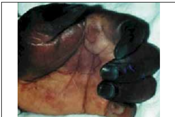
Figura 3. Necrosis más severa que llevó a la amputación de la mano. Fuente: (Quezada P, Naula M., B, Úraga W.,V, Úraga P, E. Ictioacantotoxicosis. Reporte de un caso y ubicación del mismo. Rev. Cient. Soc. Ecuat. Dermatol. Nucl.Guayas-Pichincha, Azuay. 2 (1), 2004).

El hemograma y parámetros de coagulación practicados al paciente fueron normales. La biopsia confirmó flebotrombosis superficial. Se instauró tratamiento inmediato con antibioticoterapia (no dicen con qué), antitoxina tetánica y analgésicos. Según los autores, el causante de este problema fue un pez conocido como “pez brujo” (figuras 4 y 5), que “pertenece al género Synanceja y a la familia Scorpaenidae . Se lo encuentra a escasa profundidad, por lo general enterrado en el fango de los ríos, habiéndose recibido casos de las provincias de Guayas y Esmeraldas, entre otras”.