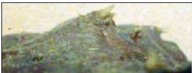
Figura 5. Espículas dorsales a través de las cuales se inocula la toxina. Fuente: (Quezada, P, Naula M., B, Úraga W.,V, Úraga P. E. Ictioacantotoxicosis. Reporte de un caso y ubicación del mismo. Rev. Cient. Soc. Ecuat. Dermatol. Nucl. Guayas-Pichincha, Azuay. 2 (1), 2004.)

Llama la atención en primer lugar el pez involucrado, ver Orcés 14 en su artículo “Nombres vulgares y su equivalente científico de peces marinos de la Costa del Ecuador”.