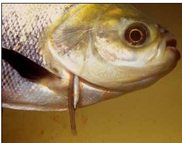
Figura 10. Candirú alimentándose de un tambaquí o cachama del Amazonas

La V. cirrhosa , se alimenta en forma natural del tambaquí, o cachama del Amazonas ( Colossoma macropomum ) al cual parasita pegándose a sus branquias con una especie de ganchos que tiene en la boca (figura 10). Por eso se le conoce también como “pez vampiro”. Es el único vertebrado que parasita al hombre.