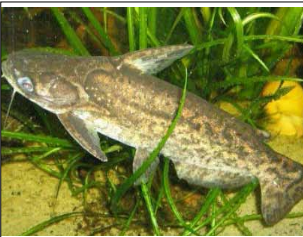
Figura 8a. P.fisheri (Trachelyopterus fisheri): macho.

En la región del Chocó lo llaman pez caga, porque es coprófago. Se alimenta de fecales humanas en las orillas de estos ríos, en las poblaciones ribereñas. Aparece en la figura 8a y 8b.