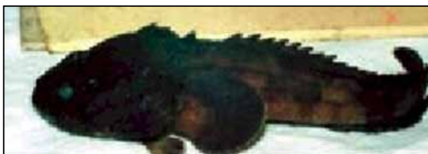
Figura 4. Pez Brujo vista lateral. Fuente: (Quezada, P, Naula M., B, Úraga W.,V, Úraga P. E. Ictioacantotoxicosis. Reporte de un caso y ubicación del mismo. Rev. Cient. Soc. Ecuat. Dermatol. Nucl.Guayas-Pichincha, Azuay. 2 (1), 2004.)

El hemograma y parámetros de coagulación practicados al paciente fueron normales. La biopsia confirmó flebotrombosis superficial. Se instauró tratamiento inmediato con antibioticoterapia (no dicen con qué), antitoxina tetánica y analgésicos. Según los autores, el causante de este problema fue un pez conocido como “pez brujo” (figuras 4 y 5), que “pertenece al género Synanceja y a la familia Scorpaenidae . Se lo encuentra a escasa profundidad, por lo general enterrado en el fango de los ríos, habiéndose recibido casos de las provincias de Guayas y Esmeraldas, entre otras”.