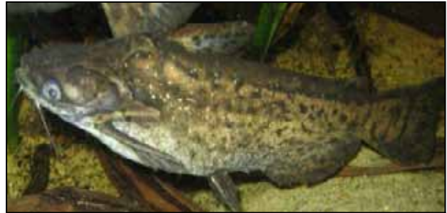
Figura 8b. P.fisheri (Trachelyopterus fisheri): hembra.

El autor tuvo la oportunidad de atender en el Atrato Medio, población de Vigía del Fuerte, departamento del Chocó, Colombia, a una joven enfermera de Medellín, Colombia, quien viajó por trabajo a este pueblo y fue mordida por este pez. En esta población hay unas letrinas flotantes, que se encuentran amarradas a una estaca en la orilla del río Atrato. A todos nos habían advertido sobre estos pececitos, que se pueden ver a través de un agujero que se hace en el piso de la letrina y saltan cuando alguien la usa. Por eso los lugareños advierten que no hay que agacharse mucho.