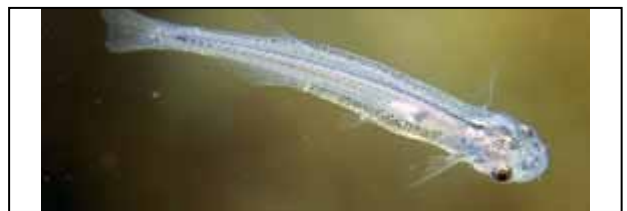
Figura 9. Candirú.

Se le conoce popularmente en Brasil como carneiro o candirú (en Portugués) y en Colombia como carnero (figura 9). Se encuentra en los ríos de la Amazonía de Colombia, Perú y Brasil; también se ha detectado en el Orinoco en Venezuela.