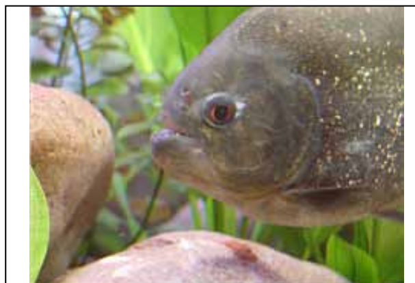
Figura 11. Piraña negra del Amazonas.

Al contrario de lo que se muestra en películas que están de moda, las pirañas normalmente no atacan a los humanos, a no ser que haya sangrado y en época de reproducción (figura 11).