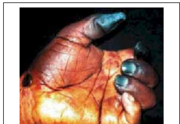
Figura 2: Necrosis de la zona afectada. (Quezada, P., Naula M., B, Úraga W., V, Úraga P. E. Ictioacantotoxicosis. Reporte de un caso y ubicación del mismo. Rev. Cient. Soc. Ecuat. Dermatol. Nucl. Guayas-Pichincha, Azuay. 2;1, 2004.)

El sitio de la herida presentó una coloración inicialmente rosada, que en pocos días fue violácea y se extendió hasta el dedo pulgar, índice, medio y anular (figura 2). A la semana, las lesiones eran negras y afectaban toda la mano, con evidencia de gangrena, por la cual se debió amputar (figura 3).