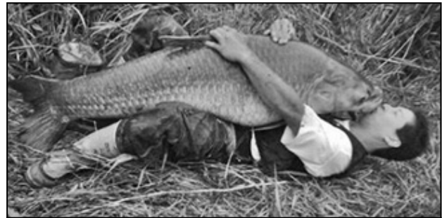
Figura 12. Pez Tigre Goliat ( Hydrocynus vittatus ).

Es un pez de agua dulce y de clima tropical (22 °C-28 °C) y se cultivan desde hace 15 años.