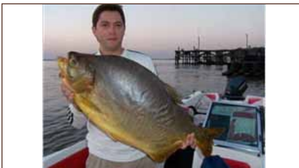
Figura 14. Picú o cortabolas.