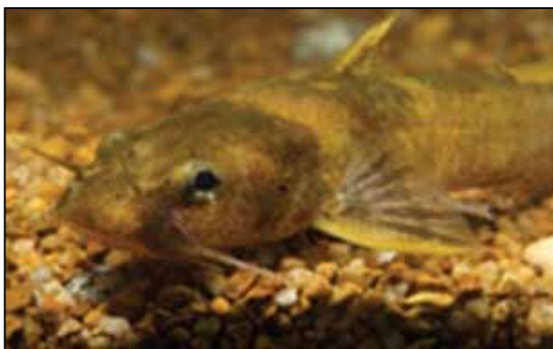
Figura 7. Pez bagre o gato (espanol.umich.edu/)

Al lado de la mandíbula superior y en algunas especies también de la mandíbula inferior, presentan apéndices semejantes a los bigotes de un gato, por lo cual se le llama también pez gato (figura 7).