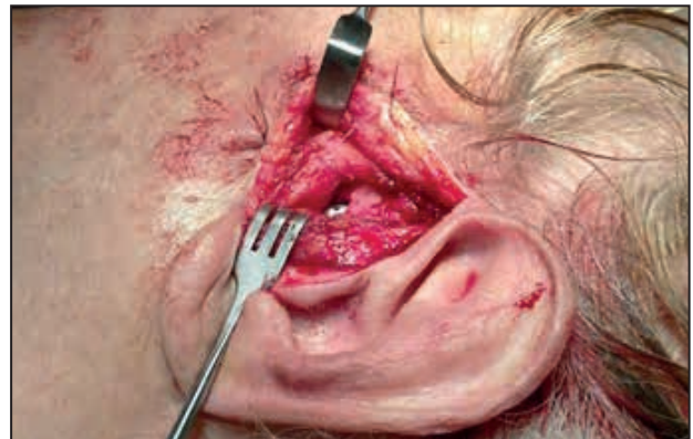
Figura 5. Pin, implantado de ATM