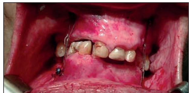
Figura 7. Cerclaje inter maxilar.