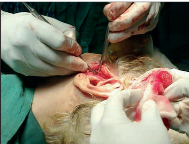
Figura 3. Abordaje quirúrgico.

Se realiza incisión pre auricular, identificando la tuberosidad glenoidea en el área pre-articular de la ATM con fresa de 4 milímetros; se realiza perforación de 12 milímetros de profundidad y en el orificio se implanta PIN de vitalium recubierto de hidroxiapatita (figura 5), el mismo que es sujetado hacia el arco cigomático con punto de Etibon 2-0; luego se diseca y se sutura (figura 6) acortando ligamento de la cápsula externa de la ATM para continuar suturando tejido preauricular y luego la piel con nylon 5-0. Se inmoviliza el maxilar superior al inferior por medio de un enmallado con alambre 4-0 fijado a tornillos colocados tanto en la parte superior como inferior (figura 7). Se termina colocando vendaje de Whuarton