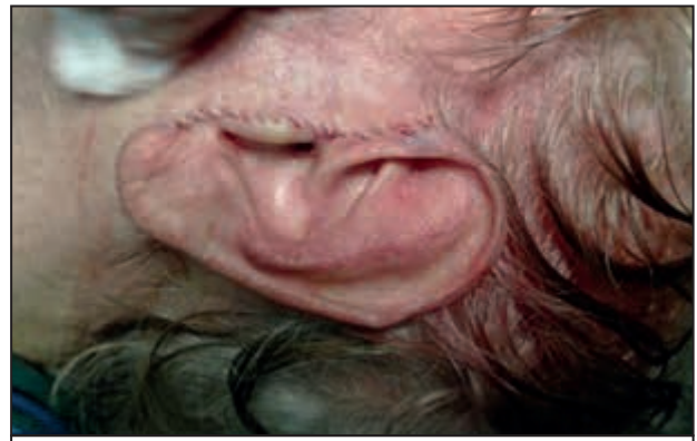
Figura 6. Cierre del abordaje quirúrgico.