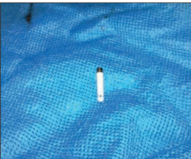
Figura 4. Pin, cubierto de hidroxiapatita (Implante de la ATM)