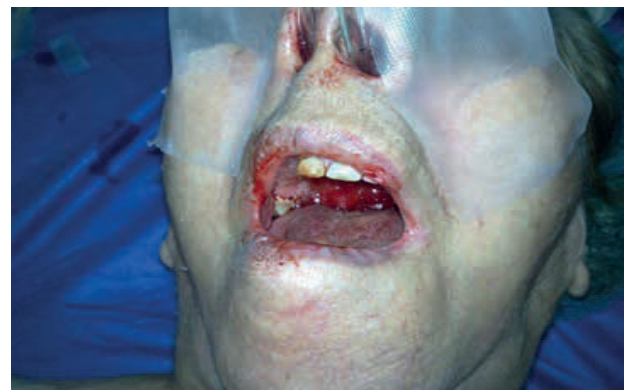
Figura 1. Luxación de mandíbula.

Paciente femenina de 84 años de edad, profesora jubilada que presenta luxación crónica recidivante de mandíbula a nivel de ATM, la misma que se presenta hasta seis veces al día, causando problema no solo a la paciente sino a su entorno familiar por la complejidad de la patología y el dolor que ésta causa al luxarse (figura 1).