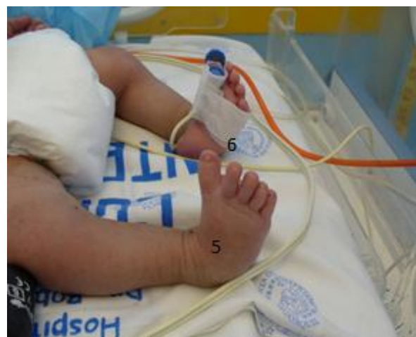
Figura 2. Pie equino varo (5) e hipoplasia ungueal (6).

Se interconsulta al Servicio de Genética quien observa fontanelas puntiformes, cabalgamiento parietal anterior, parálisis facial derecha, boca en carpa, puente nasal ancho, hipoplasia mandibular, retromicronagtia moderada, implantación baja de orejas, hipoplasia ungueal e implantación profunda, implantación baja del cabello, flexión plantar interna (pie equino varo). Luego de la valoración de los signos físicos antes descritos considera que se trata del Síndrome de Moebius por posible insuficiencia placentaria dado el antecedente de amenaza de aborto. Debido a la asociación con atresia pulmonar con CIV el pronóstico es malo debido a que no hay conexión anatómica entre el ventrículo derecho y las arterias pulmonares, lo cual es incompatible con la vida y estos niños fallecen al nacer o poco después. El paciente fallece a los 20 días de vida.