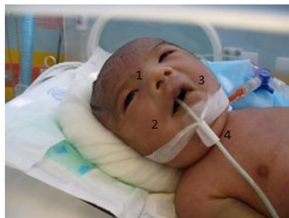
Figura 1. Puente nasal ancho (1), parálisis facial (2), boca en carpa (3), hipoplasia mandibular, retromicronagtia moderada (4), y uso de sonda orogástrica para alimentación por mala deglución.

Al examen físico llama la atención dismorfismo. RsCs: Soplo sistólico IV/VI FC 130x'; pulso periféricos y centrales palpables (Figura 1 y 2). Paciente es transferido a UCIN se le realiza ecocardiograma que reporta: atresia pulmonar con PDA grande (5mm), ramas pulmonares pequeñas, hipoplasia ventricular derecha, contractilidad normal, probable CIV pequeña, FOP. TAC de cerebro: ventriculomegalia. Ecografía renal: normal.