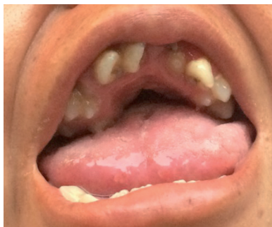
Figura 2. Maxilar superior con paladar ojival, arco maxilar en forma de V invertida con múltiples apiñamientos y mala disposición dental en ambas arcadas.

En cuanto a las alteraciones bucales, presenta boca en “carpa”, incompetencia labial, paladar ojival con múltiples apiñamientos, mala disposición dental en ambas arcadas e hiperplasia gingival generalizada. (Figura 2). 7