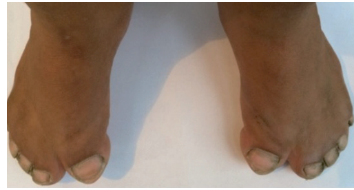
Figura 4. Sindactilia simétrica de pies.

Entre los estudios complementarios se reporta cariotipo con 46, XX cromosomas, sin ninguna alteración estructural. Así mismo, se contó con el pedigree familiar dónde se observa una nueva mutación en la tercera generación que corresponde a la paciente (III -10). (Figura 5).