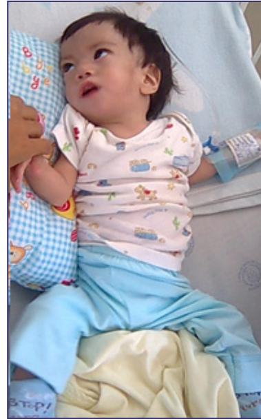
Figura 4. Se observa estado hipotónico del niño y facie inexpressiva.